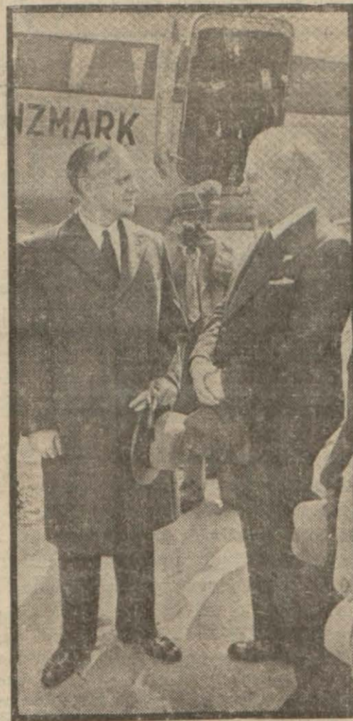
Alman Hariciye Nazırı geçen seferki seyahatinde Moskova hava meydanında